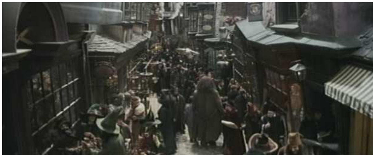
Bild 1 Diagon Alley

Det är fascinerande att första gången få en inblick i den magiska världen, efter att Rubeus Hagrid hämtat Harry Potter från den trångsynta mugglarfamilj, Dursley's (hans mosters familj), som han bott hos, sedan hans föräldrar – framstående magiska personer som verkar ha varit mycket sympatiska – mördats av Lord Voldemort. Den stora marknadsgatan Diagon Alley att döma, förefaller magiskt folk tilltalas av gammaldags och beprövad stil; inte omodern och ofunktionell, men traditionell och elegant; även om jag själv trivs bra i riktigt moderna byggnader helt styrda av datorer, finner jag stilen i HP-världen (jag kommer här efter att skriva "HP-världen" istället för "den magiska delen av HP-världen") trevlig; datorer behövs inte, emedan magin kan ersätta dessa. Banken Gringotts (som styrs av goblins , vars ursprung jag inte känner till), liksom bokhandeln Flourish & Blotts och trollstavs försäljaren Ollivander's återfinns på gatan.