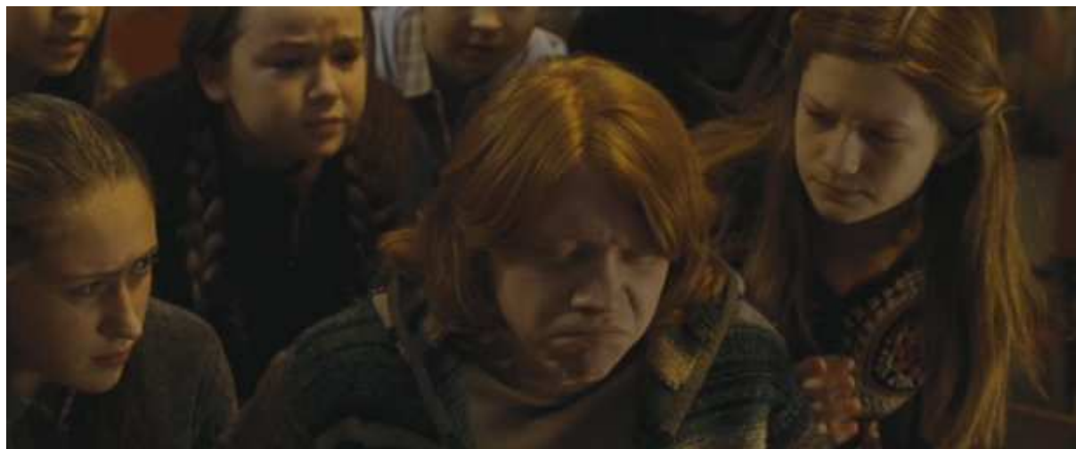
Bild 18 Ronald Weasley med systern Ginny Weasley till höger

Maximum av den varma humorn uppstår när Ron står och betraktar när the champions inträder dansgolvet på balen. Ron har tidigare sagt att han tycker synd om Hermione, som säkert "ligger på sitt rum och gråter ögonen ur sig", emedan hon inte fått någon partner. Nu får han dock syn på henne, inträdandes dansgolvet tillsammans med... Låt mig citera Rons danspartner: