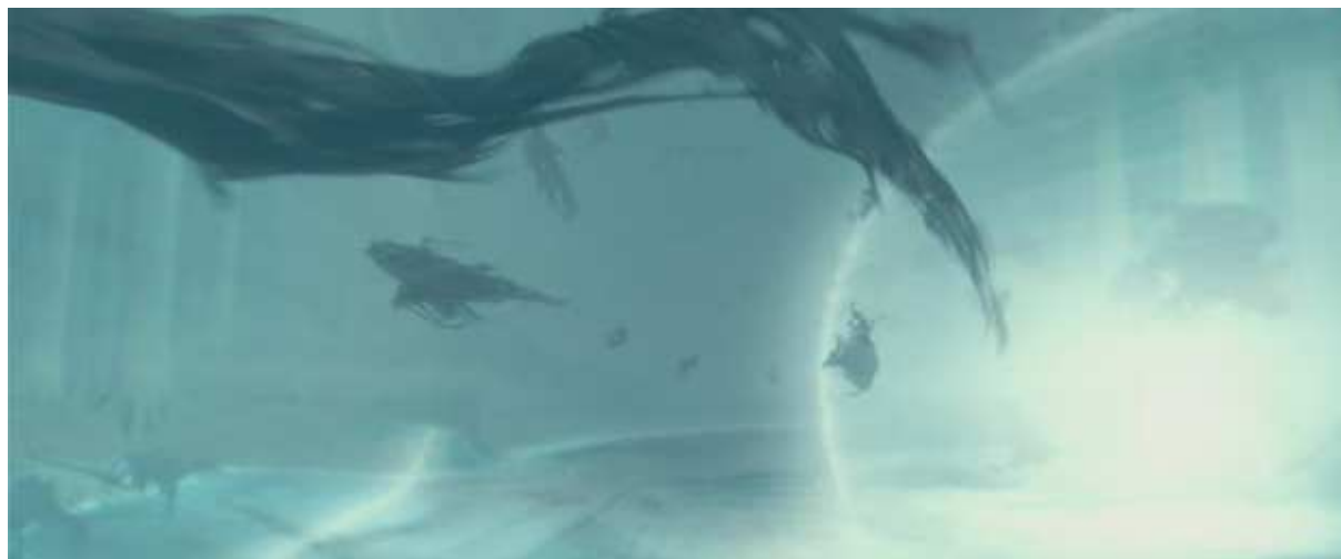
Bild 13 Harry använder Patronusformeln för att driva bort dementorerna.

Vackert är också det sista samtalet mellan Harry och Sirius, när de pratar om Harrys föräldrar, som Sirius fick träffa mycket mer än Harry själv, samt i scenerna när Harry, Hermione och sedan också Sirius flyger på Buckbeak till/från fängelsetornet: den storslagna vibrerande musiken återkommer, och natthimlen är dramatiskt färgad av tjocka moln.