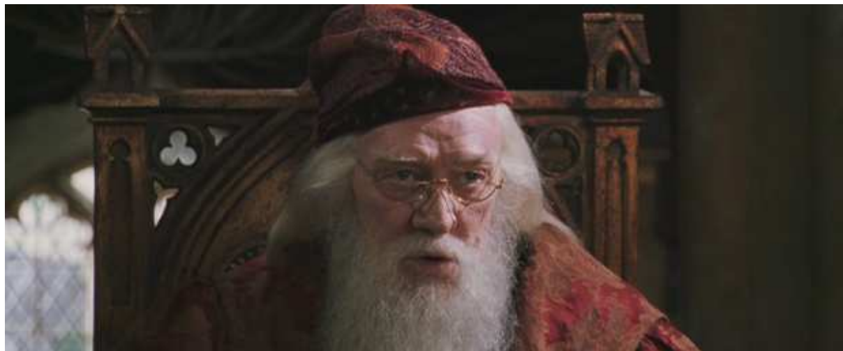
Bild 7 Albus Dumbledore

skärmar och låta Microsoft utveckla en programvara som visar ett "levande" porträtt man kan tala med via artificiell intelligent. Jag gav dock upp tanken, när jag insåg att detta skulle kosta några miljarder dollar. Dessutom skulle dylika program inte ha något medvetande, vilket jag antar att personerna i tavlorna på Hogwarts har. Förutom dessa tavlor, är Dumbledores rum fyllda av mångtaliga böcker och andra, eleganta föremål.