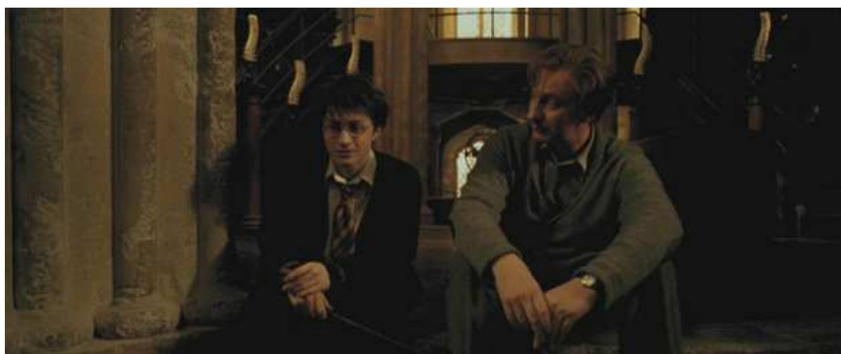
Bild 12 Harry och Lupin, strax efter att Harry har lärt sig patronusformeln

Också fantastiskt vackert förnimmer jag musiken och scenerna när Harry flyger på hippogriffen Buckbeak över Hogwarts och den där liggande sjön. Musiken är vibrerande, vilket gör den storslagen och mäktig.