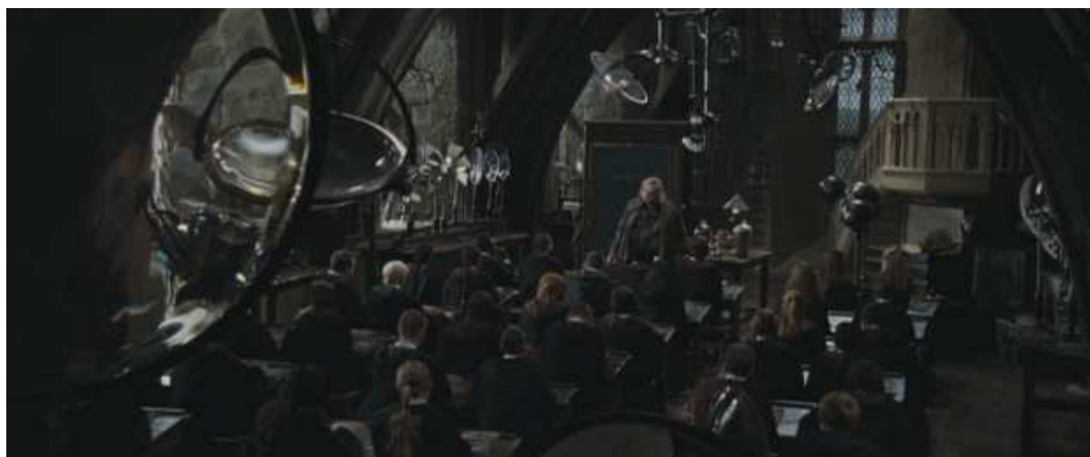
Bild 15 Moody undervisar om unforgivable curses .

Hermione imponerar moraliskt i början av HP4, när hon – som ensam person – skriker ut över klassen, och säger åt den nya läraren i försvar mot svartkonster, Alastor "Mad-Eye" Moody (eller snarare Barty Crouch Jr. under påverkan av Polyjuice Potion ), att upphöra med Cruciatusförbannelsen mot spindeldjuret och Neville Longbottom. Själv finner jag det tungt att se denna scen, ty man verkligen ser hur spindeldjuret lider av formeln; det "skriker" och vrider och vänder på sig så gott det förmår. Senare, efter lektionen, beklagar sig Hermione över att "oförlåtliga" (per definition) förbannelser inte ska utföras i klassrum. Imponerande, att hon ensam ställer sig emot Moody.