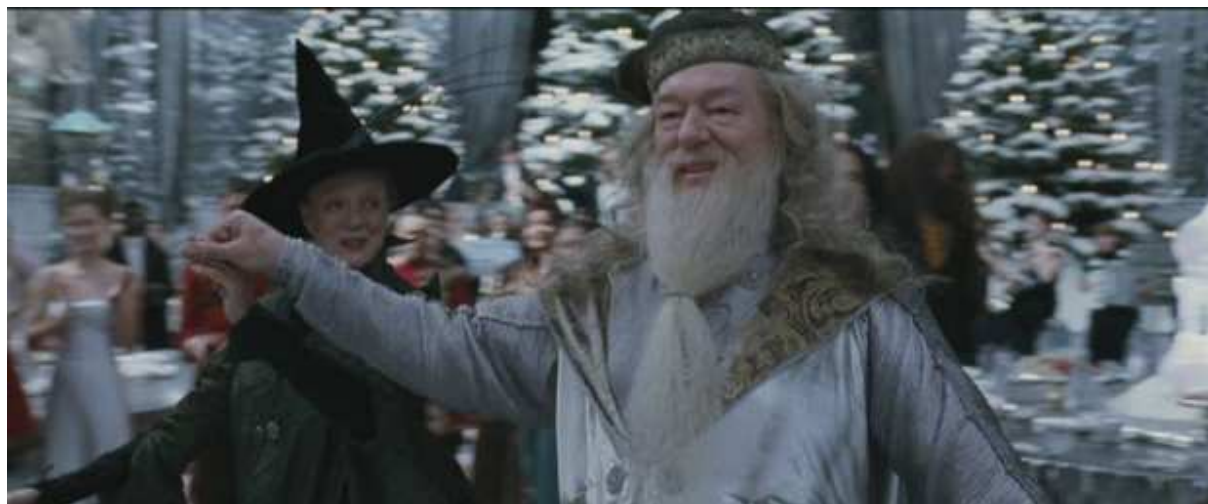
Bild 20 McGonagall och Dumbledore på dansgolvet

Den vackra musiken, som fångat mig redan innan jag ens börjat se på filmen, kommer tillbaka i den allra sista scenen, och känns då som en gammal kär vän, vilken det nu är vemodigt att lämna. Liksom filmen i stort, är eftertexterna en kompromiss mellan HP1 och -2 å ena sidan, och HP3 å andra; första delen är en animation av lappar, som flyger upp ur bägaren, medan andra delen utgörs av vanlig vit, rullande text på svart, fix bakgrund. Något nytt i efterspelet, dock, är att det är sång till musiken ("nytt" bortsett från kören i HP3); låten Magic Works , liksom all musik, gör efterspelet även här till en underskön upplevelse. Efter filmen inser man, att titeln Den flammande bägaren snarast är någon form av humor; filmen handlade om långt mer allvarliga saker än bägaren och tävlingen. Den handlade om moral, styrka och vänskap.