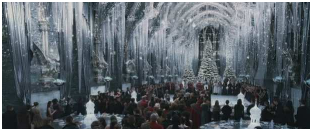
Bild 19 the Yule Ball

Efter sjötävlingen visade Dumbledore återigen god moral, och att han går sin egen väg, moralens väg, hellre än de formella reglernas väg, genom att tilldela Harry andraplatsen för sina "moraliska fiber". Ännu tydligare visas Dumbledores moral sedan Barty Crouch Senior blivit mördad, och Dumbledore vill avbryta tävlingen. Cornelius Fudge vägrar emellertid, varvid Dumbledore yttrar sig: