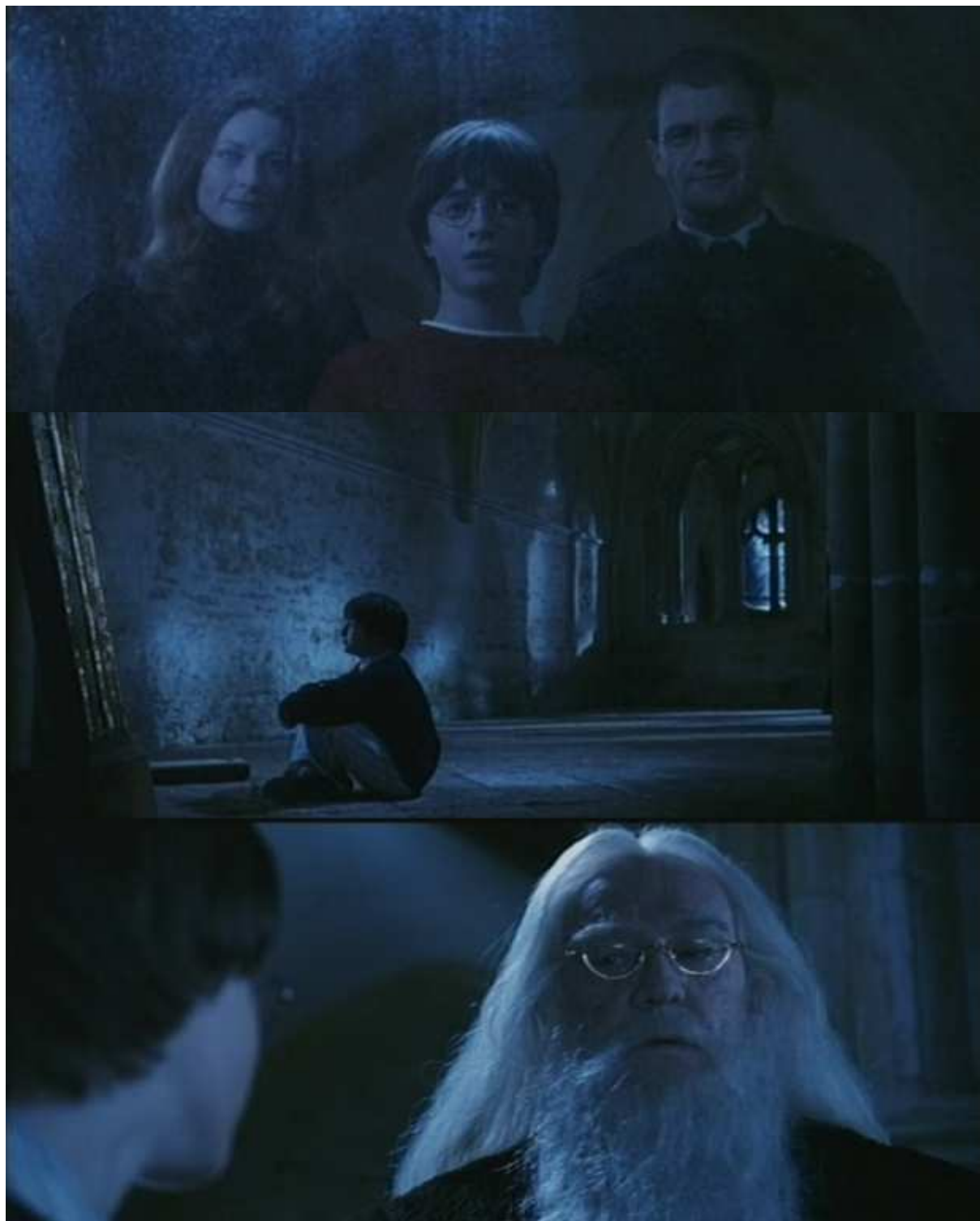
Bild 4 Mirror of Erised

Tanken har mer än en gång slagit mig, att denna visdom är något jag borde ta del av.