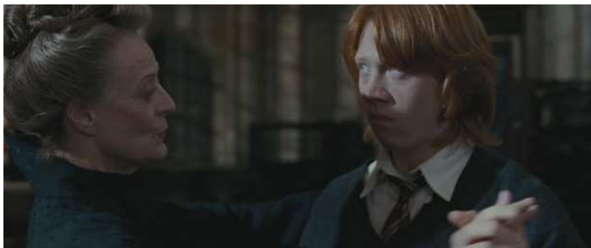
Bild 16 McGonagall dansar med Ronald Weasley

Efter den första utmaningen, är det dags för the Yule Ball . Detta avsnitt är onekligen det bästa jag någonsin sett i HP-världen; det är fullt av varm humor, vackra scener och fantastisk musik. Det börjar med Harry, som sittandes i den stora salen för en måltid, får syn på Cho Chang, en kvinnlig elev, till vilken han tydligen känner en attraktion. Hon råkar vända sig om mot Harry, som då i förvåning råkar spotta ut lite av juicen han har i munnen. Det fortsätter sedan med Ron, som av sin mor får en dress robe till balen, men inte förstår detta, utan utgår ifrån att kläderna är åt Ginny. Snart därefter är det dags för dansträning med McGonagall, som i exemplifierande syfte bjuder upp Ronald. Den senare finner det något "penibelt" och Harry frågar bröderna Fred och George, om de någonsin kommer att låta honom "glömma" situationen. Svaret blir givetvis "Nej!". Hela situationen genomsyras av en varm humor och svårslagbart vacker musik.