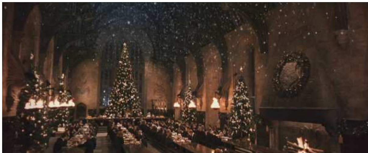
Bild 5 The Great Hall

Precis som i HP1, forsstätter Dumbledore att imponera stort. När nästan alla trodde att Harry var den som öppnat hemligheternas kammare, så litade Dumbledore på Harry, och utgick från att Harry var oskyldig. När Dumbledore senare i filmen äntrar Hagrids hydda, får man nästan intrycket av att han har förmåga att se igenom Harrys osynlighetsmantel, vilket då skulle stämma väl in med de förmågor och den "kontroll" över situationen som Dumbledore besitter. Mest imponerande av allt, emellertid, finner jag Dumbledores reaktion när han av den "onde" Lucius Malfoy får reda på att han blivit avskedad, utan anledning och trots att knappast någon kunde vara en bättre rektor för skolan än just Dumbledore. Istället för att ens argumentera, bugar han sig och säger lugnt, nästan viskande: