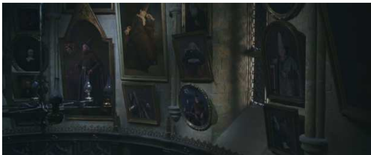
Bild 6 Några tavlor högt uppe på väggarna i Dumbledores stora arbetsrum

Denna självbehärsknig är imponerande, och man kan bara önska att det fanns fler människor som Dumbledore i den verkliga världen. Själv har jag inte träffat på någon lika lugn och vis.