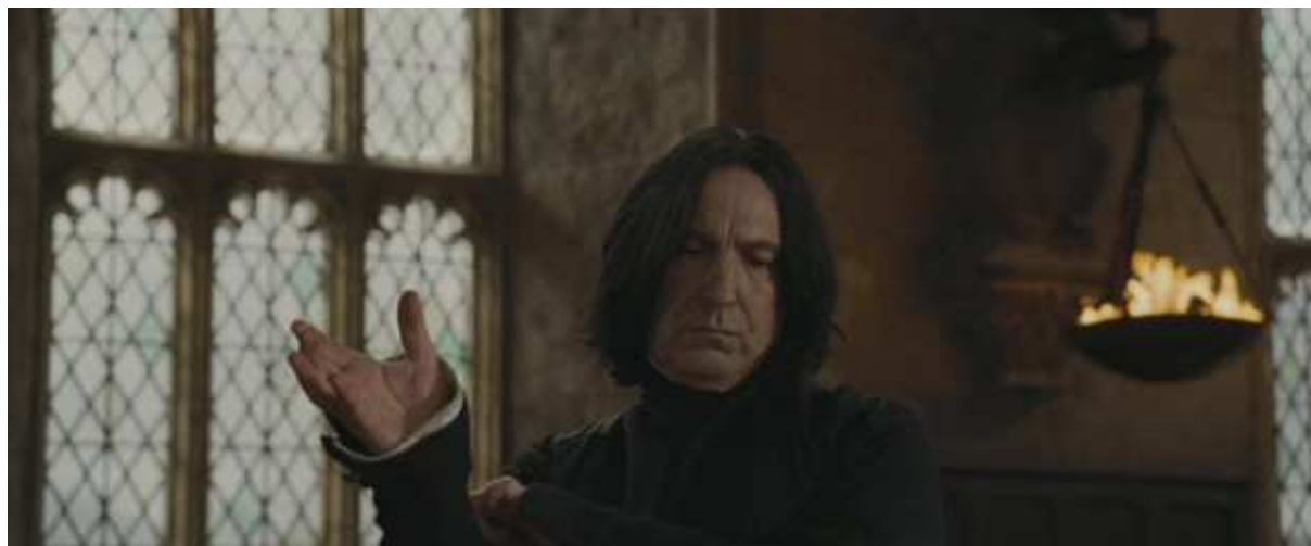
Bild 17 Snape kavlar upp ärmarna.

Snape, som tidigare sagt åt Ron och Harry att sitta tyst under provet, genom att lite försiktigt ha slagit till dem på huvudet, kavlar upp ärmarna, går fram till de två om partners seriöst diskuterande eleverna och trycker ner deras huvuden mot bordet, i en atmosfär av varm humor; det är nästan som om Snape accepterar deras beteende, genom att svara med humor, om än diskret sådan.