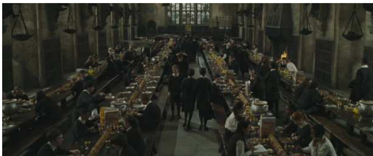
Bild 22 Gemensam måltid

Det jag finner trevligt är närheten till sina medmänniskor, att alla elever och lärare, bor tillsammans i det stora, ”trygga” slottet, där de också får den intellektuella stimulans av undervisningen (och forskningen, för lärarna?) de behöver; eleverna sover tillsammans (uppdelat endast i de fyra elevhemmen och i de två könen), samt samlas och äter tillsammans i den stora hallen.