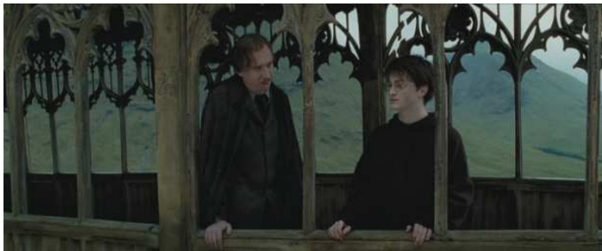
Bild 11 Harry och Lupin på bron

Också fantastiskt vackert förnimmer jag musiken och scenerna när Harry flyger på hippogriffen Buckbeak över Hogwarts och den där liggande sjön. Musiken är vibrerande, vilket gör den storslagen och mäktig.