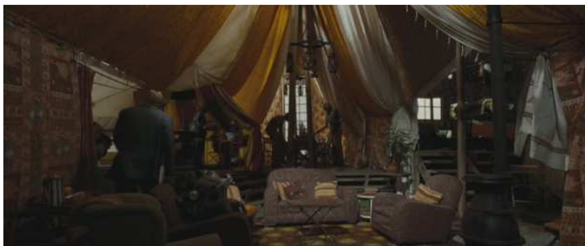
Bild 21 Weasley-faderns och -brödernas, Harrys och Hermiones tält under VM

Om jag gjorde en film, skulle människorna i den bete sig såsom jag finner mest moraliskt "idylliskt" (såtillvida att jag inte just vill visa vad som händer "annars"). Representerar HP-världen