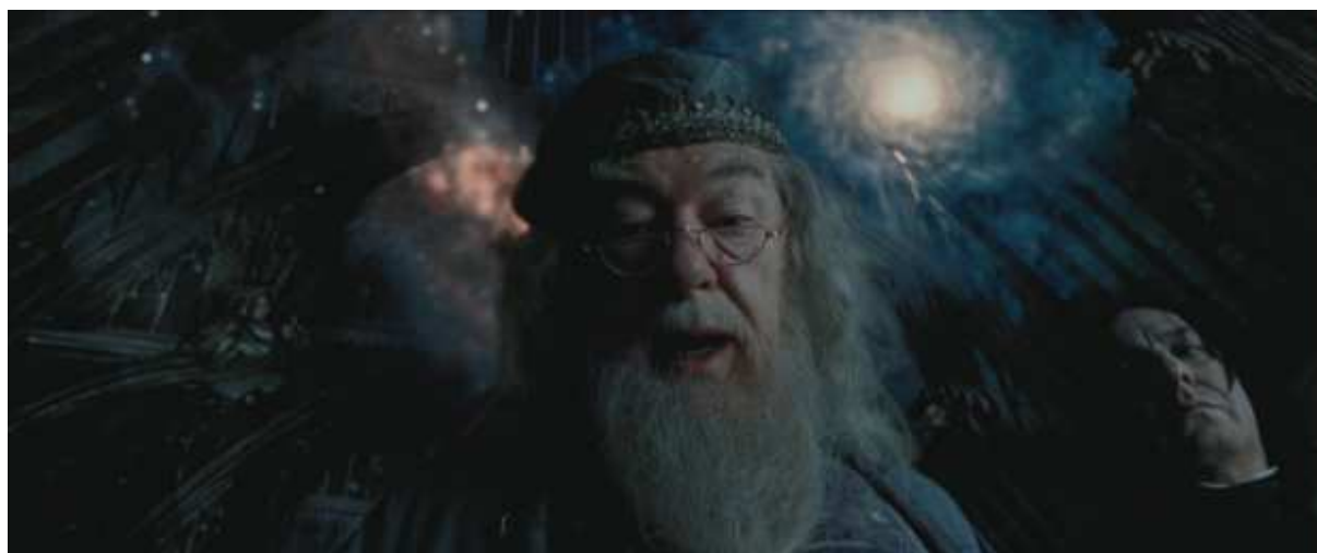
Bild 23 Albus Dumbledore i stora hallen, med galaxbilder i taket

Å andra sidan, är det kanske just det som det gör? Kanske kan filmer ge mental styrka? Kanske kan filmer inspirera människor, att undvika det negativa från filmerna i verkligheten, och främja det positiva från filmerna i verkligheten? Kanske kan filmer inspirera människor, till att assimilera de bästa personlighetsdragen i filmerna till ens egen personlighet? Kanske kan man skapa sig en egen värld, i den verkliga världen, som har samma moraliska idyller som i en film? Kanske är filmen verklighet 3 ?