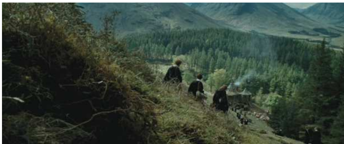
Bild 9 Landskapet strax utanför Hogwarts

Landskapet är delvis nytt i HP3, spontant till min besvikelse, eftersom detta bryter kontinuiteten till de två första filmerna; detta kan dock lösas med lite fantasi. Egentligen tycker jag inte desto mindre att landskapet i HP3, vilket utgörs av skogsklädda berg och dalar, är mycket tilltalande. Hogwarts verkar också något omdesignat: den gröna uteplatsen från HP1 och HP2 syns inte till, medan en stenig uteplats har tillkommit. Dessutom har en bro tillkommit, vilken jag inte såg i HP1 eller HP2. Vidare, har the Whomping Willow samt Hagrids stuga fått nya platser, vilket är lite tråkigt.