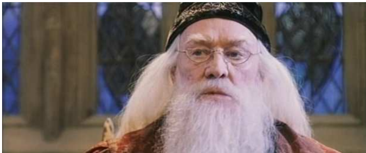
Bild 2 Albus Dumbledore

Hogwarts är vidare minst lika fascinerande som Diagon Alley. Det är ett stort, elegant slott och med ett närapå gigantiskt ytstort och framförallt högt trapphus med trappor som flyttar på sig av sig själva. Väggarna är prydda med tavlor (främst gammeldags, stiliga sådana med porträtt). Personerna som tavlorna porträtterar har liv; "tavlorna rör på sig", sade en elev. Skolans stora samlingsaal, the Great Hall , som också fungerar som matsal, har ett tak som är förtrollat. Taket ser normalt ut som en tredimensionell natthimmel, men kan (sannolikt endast av Dumbledore) göras om. Vid halloweenfesten är taket omgjort till en natthimmel med åskväder (mycket mysigt om man frågar mig); på julen snöar det från taket (även om snön aldrig når ända ner till golvet). Måltiderna på skolan, särskilt festmåltiderna, är utomordentliga och ojämförbara med något i verkligheten. Första skoldagen bjöds på storslagna tårter, glass- och chokladkonstruktioner och en utomordentlig rikedom av mat, och allt detta trollades fram av Dumbledore i en handklappning, bokstavligt talat.