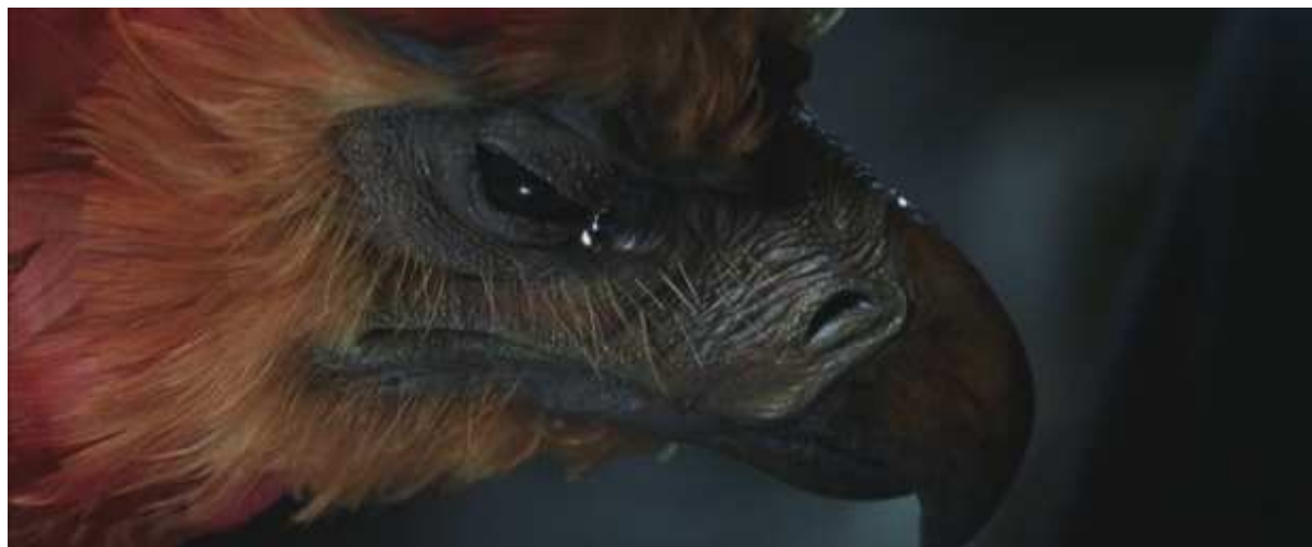
Bild 8 Fawkes personifierar det kloka djuret

Musiken i HP2 liknar den i HP1. Dock ändras musiken, till ett oerhört vackert stycke, varje gång Dumbledores phoenix Fawkes 1 syns i bild. Speciellt sista scenen i grottan, när musiken ändras och Fawkes flyger fram till Harry, och med sina tårar läker Basiliskens bitsår, är fantastiskt vacker.